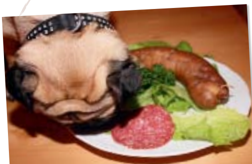
Ein Brotzeitler für den Hund – natürlich mit hundegerechter ungewürzter Wurst

Gasthof Rotes Roß, Ludwigstr. 9, 95111 Rehau www.ropes-ross-rehau.de