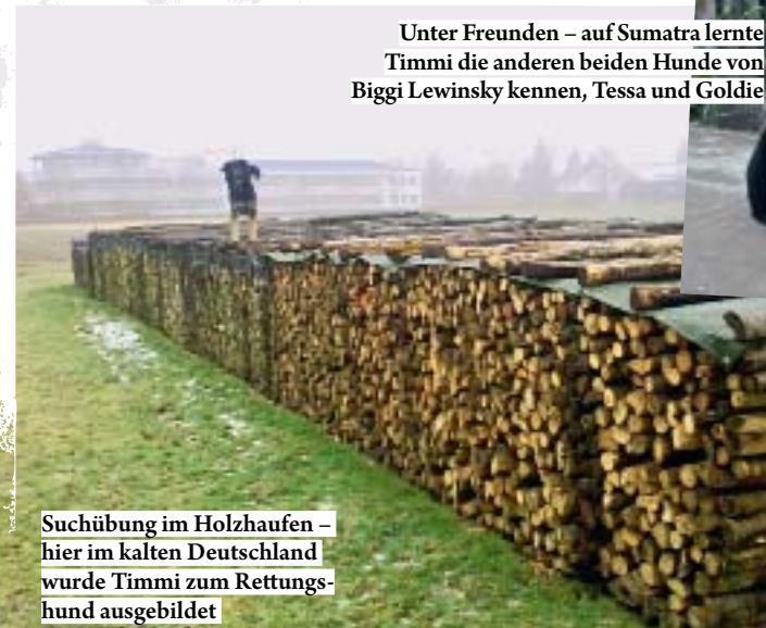
Suchübung im Holzhaufen – hier im kalten Deutschland wurde Timmi zum Rettungshund ausgebildet